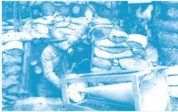
[Artilleur du 259 e régiment d'artillerie dans un poste d'alerte] - Anonyme - France, 1918 - Positif sur film Don Hellot (07-2014) ©Musée de la Grande Guerre, Meaux

Cette conférence explore l'histoire méconnue de l'arme chimique durant la Première Guerre mondiale. Elle s'intéresse à son impact réel sur le conflit, à travers une approche militaire, tactique, technique, industrielle et humaine, pour mieux comprendre cette « guerre dans la guerre », souvent reléguée au second plan.