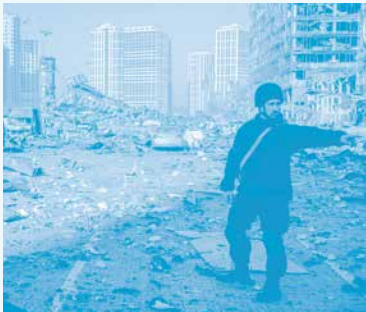
Ruines - Chloe Sharrock ©Chloe Sharrock