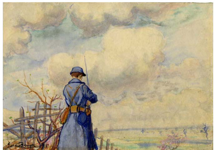
La nouvelle tenue couleur d'horizon, Avril!

Le XIX e siècle se caractérise par des uniformes aux couleurs vives rendues indispensables pour se reconnaître lorsque les fumées des canons plongent le champ de bataille dans un brouillard épais. Mais, à partir de 1884, la poudre sans fumée, inventée par un Français, Paul Marie Vieille, remplace la poudre noire. Cela permet aux armées d'adopter des teintes plus neutres : le Royaume-Uni adopte le kaki en 1902 et l'empire allemand le Feldgrau en 1907. Seule la France conserve le pantalon rouge