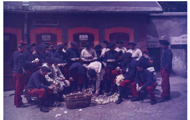
La corvée de patates, France, 1913, Plaque autochrome CE2025.34.3

On peut demander aux élèves de faire une rapide recherche chez eux afin de sélectionner une photographie qui représente pour eux la Grande Guerre. Il est probable que la plupart de ces images seront en noir et blanc. On peut alors poser la question : « À quoi ressemblait ce conflit pour ses contemporains qui l'ont vu en couleur ? ». Cela permet de justifier la visite.